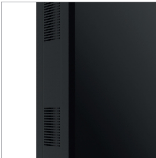
Displayspezifisch angepasst, z.B. Belüftung, Infrarotsensor

Die Oberfläche der Stele ist mit einer korrosionsbeständigen, hochwetterfesten Kunststoffpulverbeschichtung in schwarz (RAL 9005) veredelt.