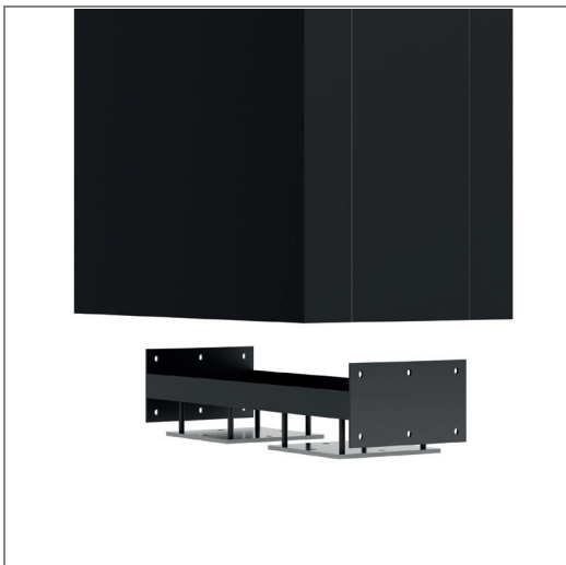
Bodenbefestigung inkl. Niveaueingleich